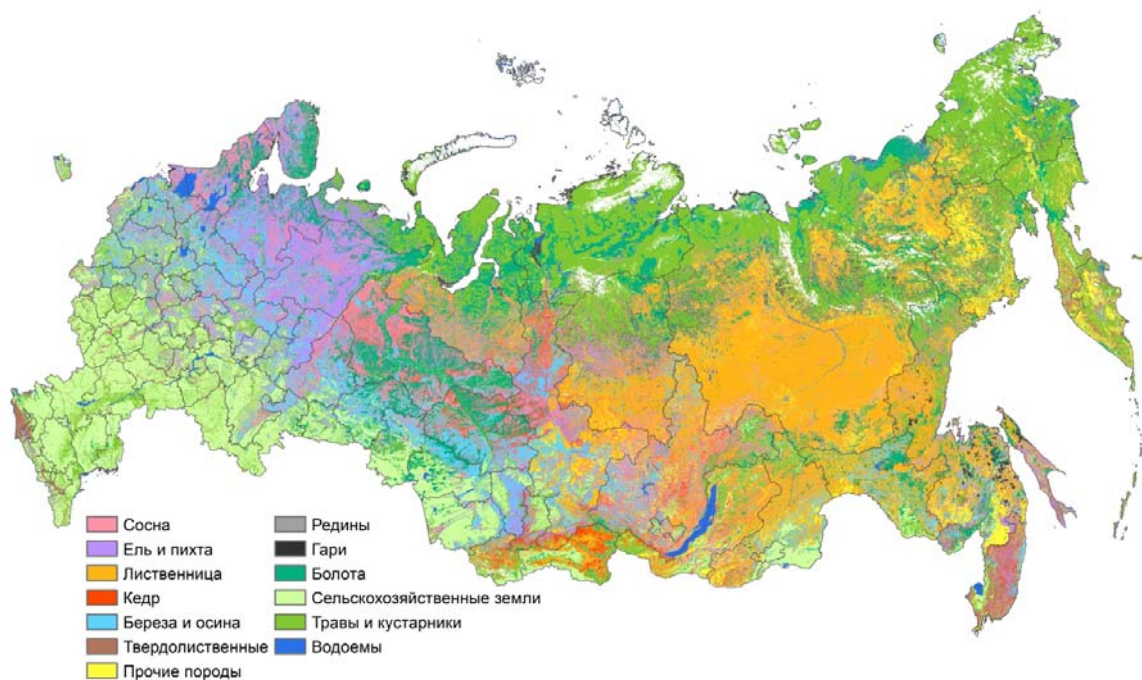
Рис. 1. Растительность России с указанием основных лесообразующих пород.

венного разрешения, а соответствующие биофизические показатели лесных экосистем (такие как возраст и запас древостоев) были обновлены по специальной системе в зависимости от времени последнего учета (Shvidenko et al., 2010a). Всего в рамках настоящей работы для различных целей использовано 12 инструментов с восьми различных спутников, среди которых TERRA MODIS, ALOS PALSAR, ENVISAT ASAR, LANDSAT и др. Полученное распределение покрытых лесом земель (ПЛЗ) России по биоклиматическим зонам и преобладающим породам приведено в табл. 1 и на рис. 1 (все расчеты относятся к периоду 2007–2009 гг.).