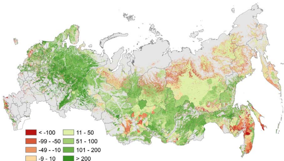
Рис. 3. Чистый экосистемный углеродный бюджет лесов России.

Знак (+) в легенде обозначает сток углерода, знак (–) – источник. Размерность потоков – \text{г С м}^{-2} \text{ год}^{-1} .